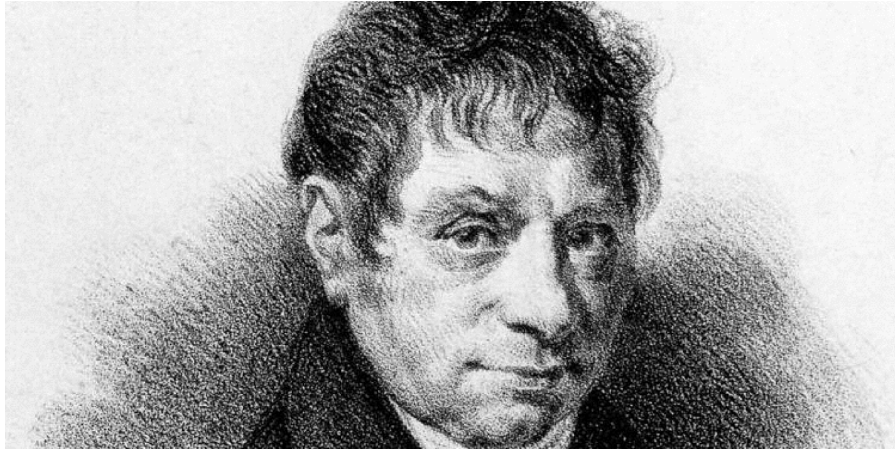
Jean-Baptiste Say (1767-1832)

så jobber som erstattes av roboter ett sted skaper nye jobber et annet sted ... eller kanskje et tredje eller fjerde...